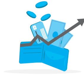
Gharama ya kutunza magari yaliyowahi kutumika