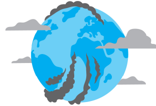
Uzalishaji wa gesi chafu na uchafuzi kwa mazingira