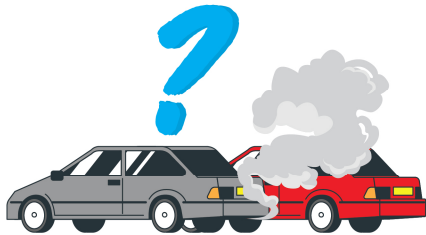
Ubora na usalama wa magari yaliyowahi kutumika