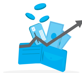
Затраты на эксплуатацию подержанных автомобилей