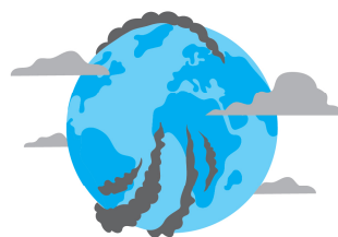
二手车的污染物和温室气体排放